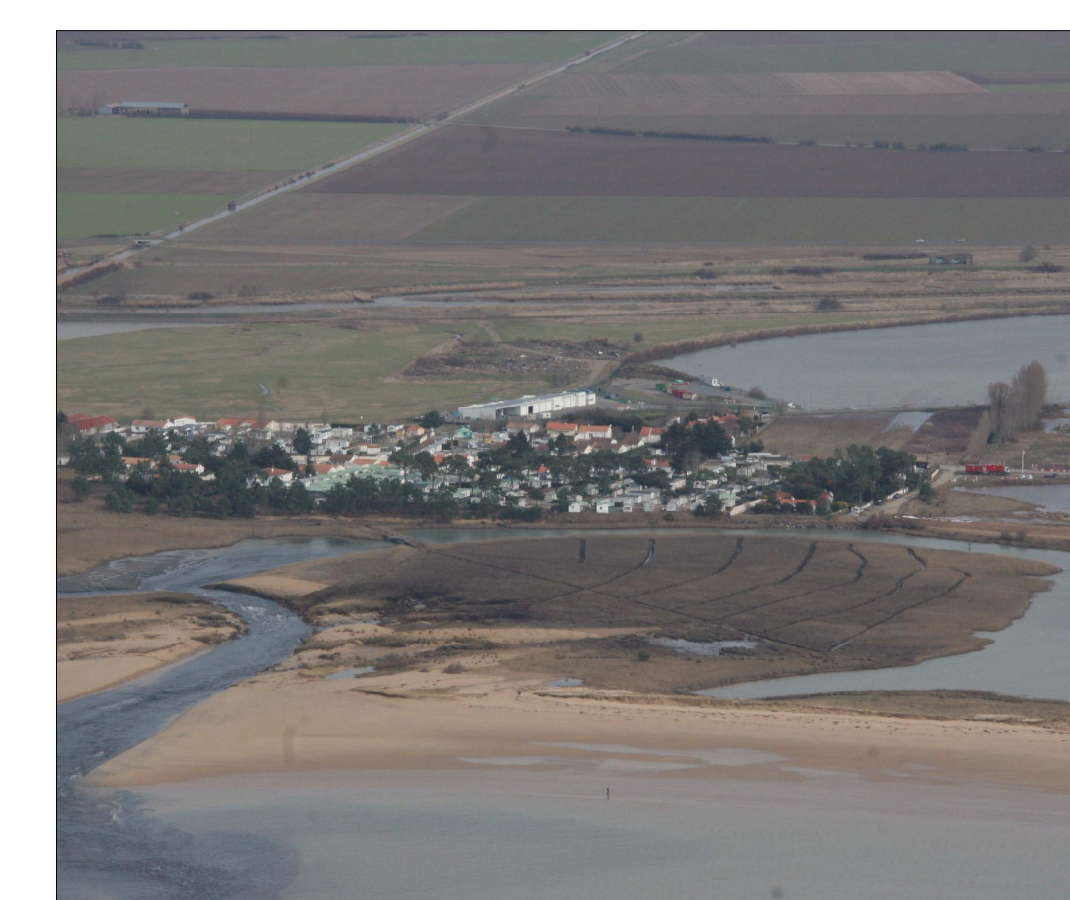
Lagune de la Belle Herminette suite au passage de Xynthia Plan de zonage réglementaire Plan N°2